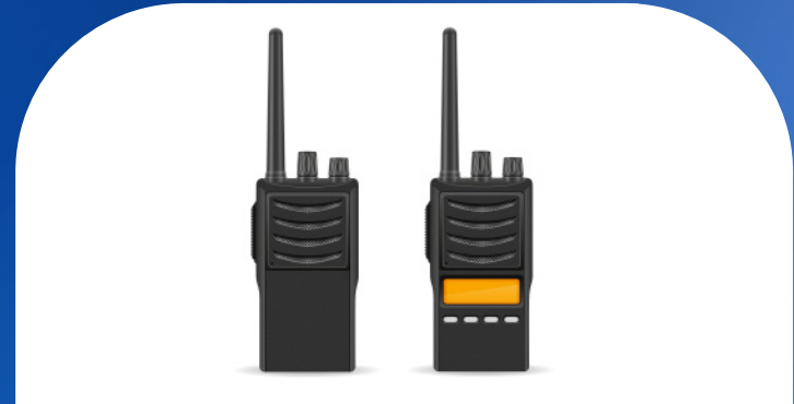
Radios de largo alcance