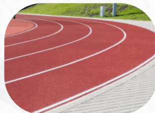
Institutos deportivos e hipódromos