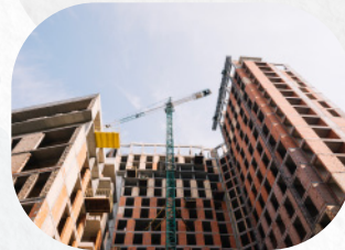
Instalaciones temporales de obras y proyectos