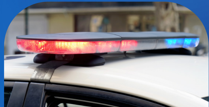
Apoyo de los cuerpos policiales, guarniciones (GN) y cuerpo de bomberos