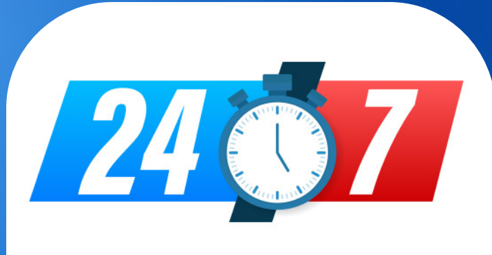
Supervisión las 24 horas