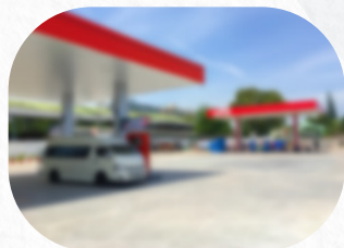
Estación de servicio de combustible