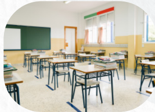
Colegios e instituciones educativas