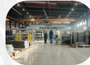
Equipos pesados, livianos e industriales